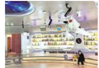
理在·阅空间未来剧场——喂泥剧场