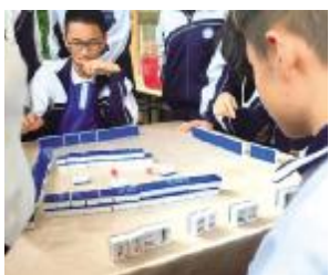
学生在打化学麻将